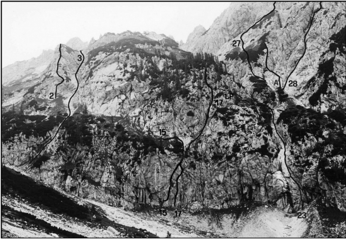
Mrzla gora: 2 Pajkova mreža, 3 Dopoldanska grapa, 15 Miš-maš, 17 Smer slovesa, 27 Fotografška, 27A Oktobrska revolucija, 28 Zahodna smer, LP lovška pot.