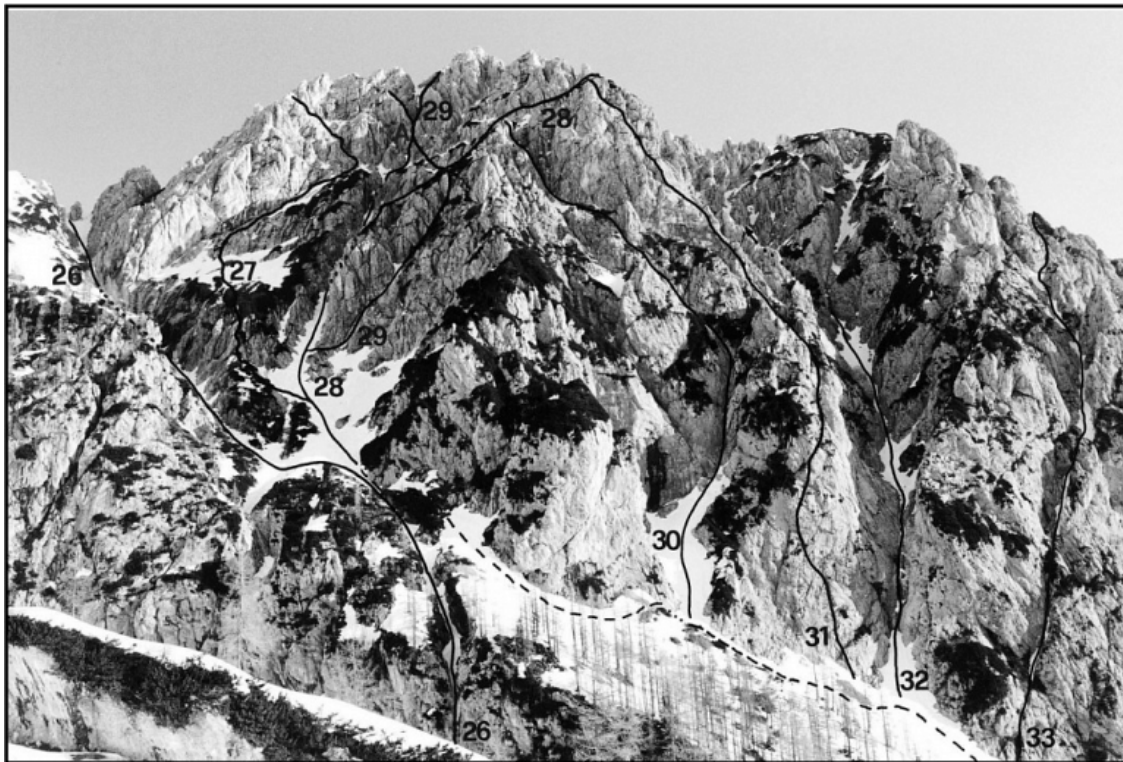
Mrzla gora: 26 Vzhodna grapa, 27 Fotografska, 28A Varianta skozi okno, 28 Zahodna smer, 29 Sprehod, 30 Kocka, 31 Majska smer, 32 Centralna grapa, 33 Poševna grapa, --- dostop do smeri.