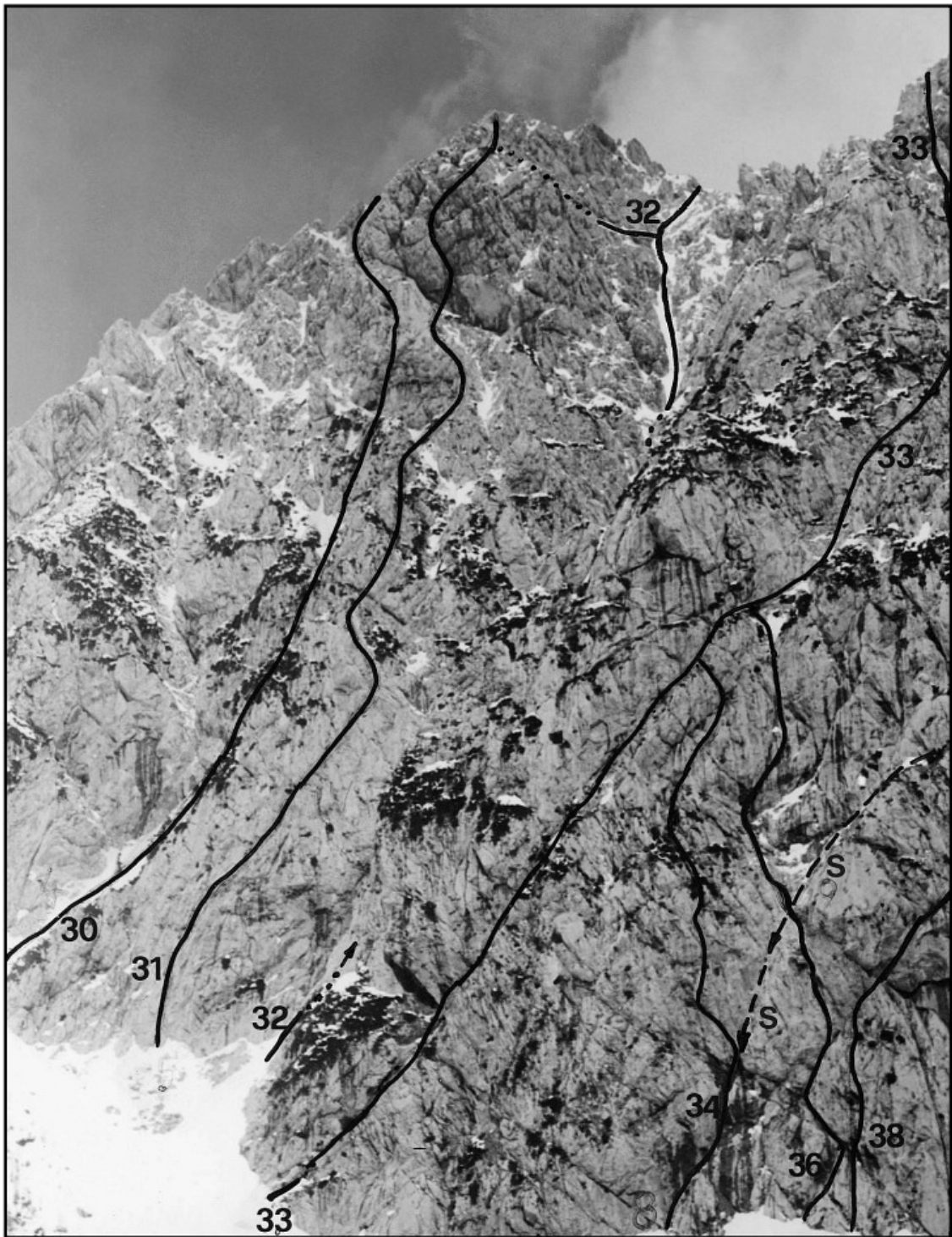
Mrzla gora: 30 Kocka, 31 Majska smer, 32 Centralna grapa, 33 Poševna grapa, 34 Leva smer, 36 Jesenska smer, 37 Smehljaj, 38 Avrikelj, S sestop (s spusti po vrvi).