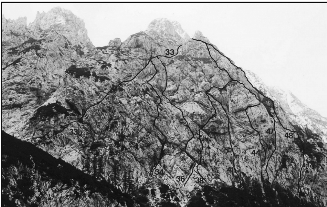
Mrzla gora: 33 Poševna grapa, 34 Leva smer, 36 Jesenska smer, 38 Avrikelj, 41 Direktna smer, 44 Zadoščenje, 47 Smer Ipsilon, 48 Smer desno od Ipsilon.