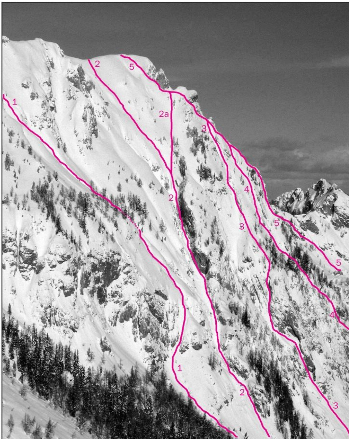
Robičje, vzhodna stena: 1 Sestopna, 2 Meniskusov žleb, 2a Direktna izstopna varianta, 3 Skrita grapa, 4 Zgrešena, 5 Prečenje.