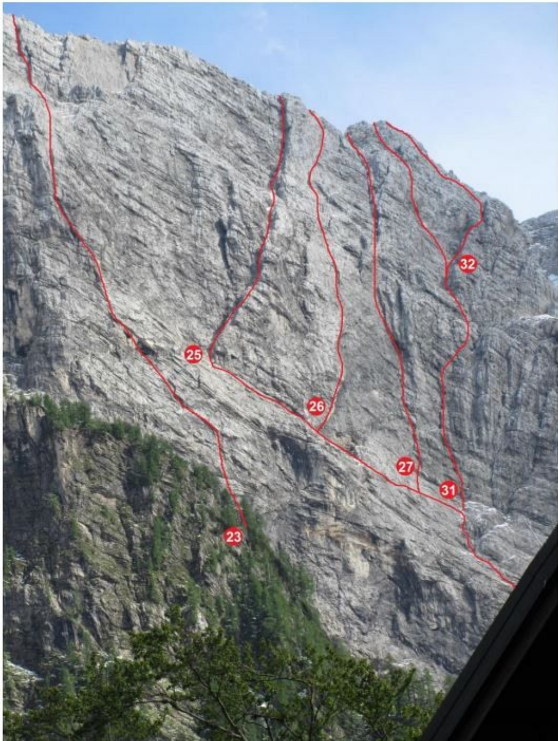
23 Petelin, 25 Nad Slatnicami, 26 Jesenska, 27 Krvavi pot, 31 Pahljača, 32 Var. Pahljače.

Velika Mojstrovka, severna stena: 23 Petelin, 25 Nad Slatnicami, 26 Jesenska, 27 Krvavi pot, 31 Pahljača, 32 Varianta Pahljače.