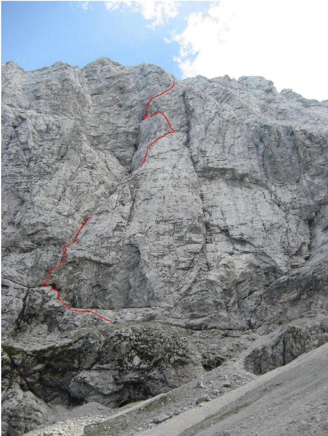
Šite, severna stena: Steber Šit (vris).