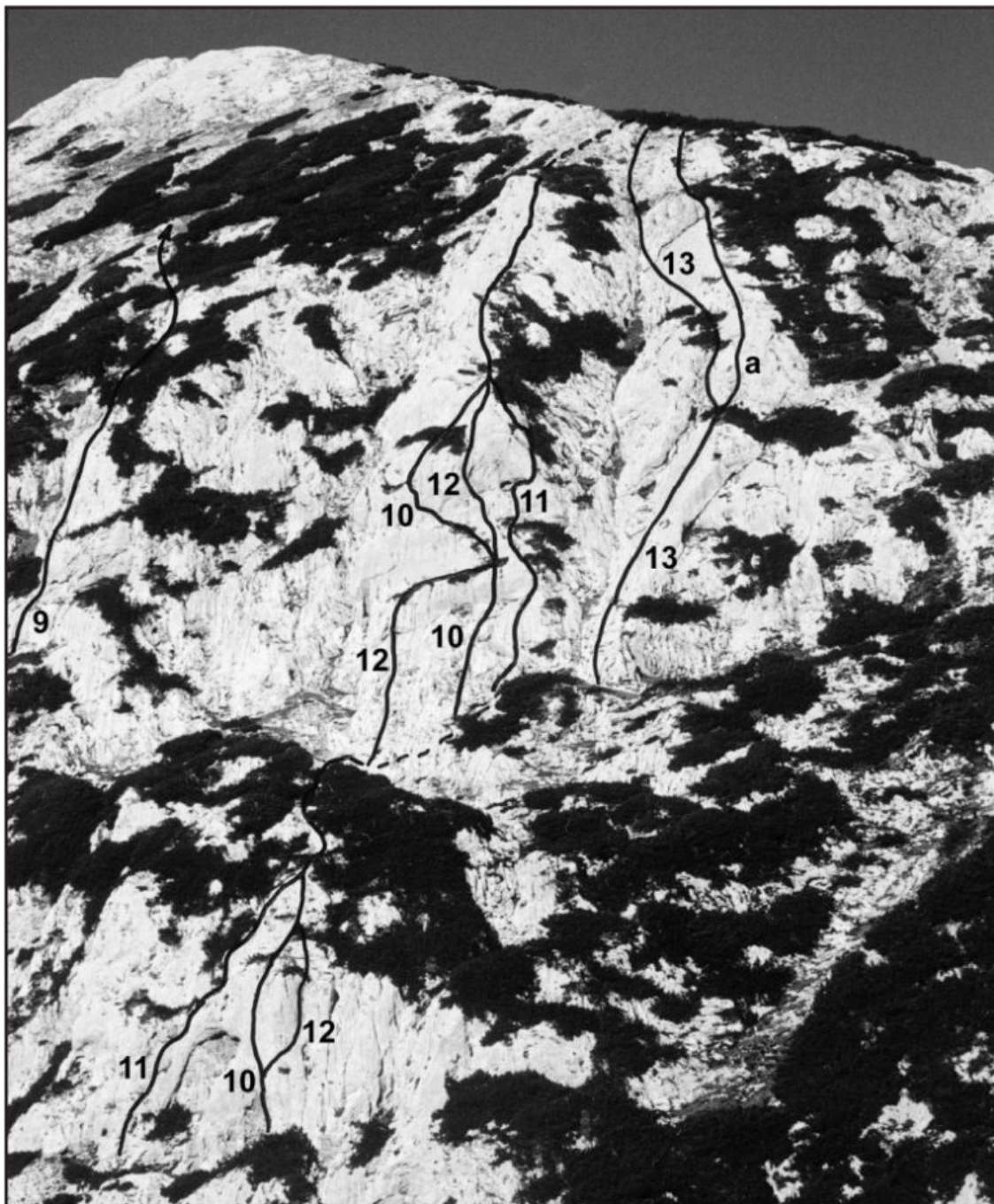
Veliki vrh - jugozahodna stena: 9 Samotna smer, 10 Čez plošče I, 11 Obvoz, 12 Čez plošče II, 13 Sestopna, 13a Izstopna varianta.